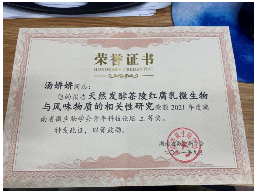
图3 学生参加学术交流获奖