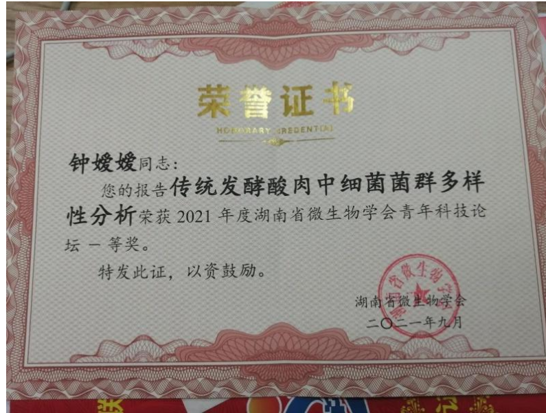
图2 学生参加学术活动获奖