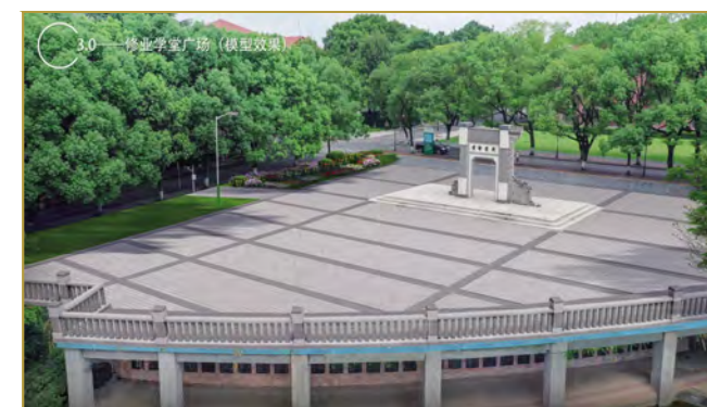
3.0——逸苑学堂广场（模型效果）